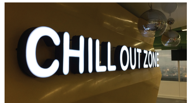
ป้ายอักษร